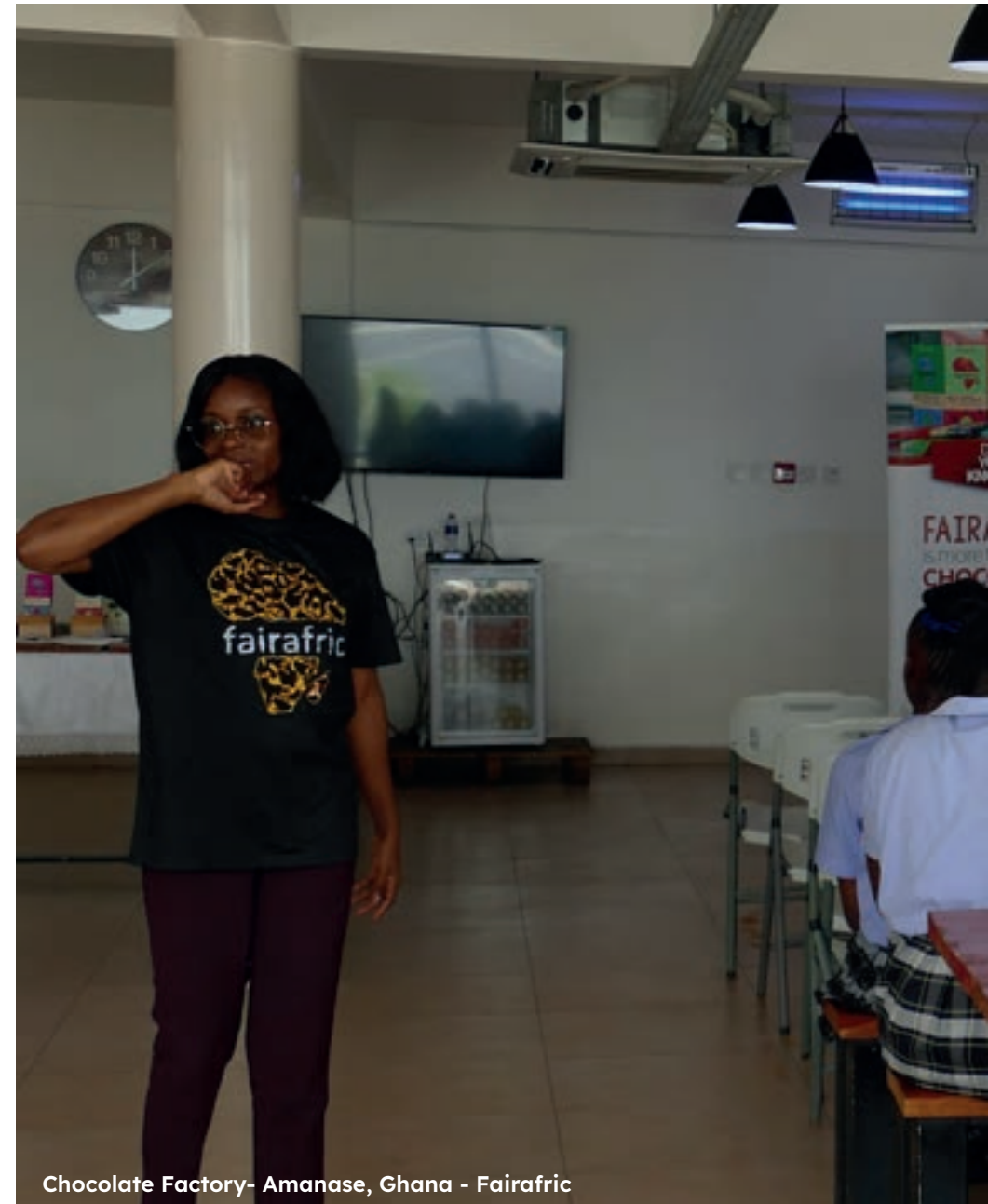
Chocolate Factory- Amanase, Ghana - Fairafric

La garantie d'un prix juste permet aux producteurs et productrices d' augmenter leurs revenus pour couvrir les coûts de production et les coûts de la vie. Le commerce équitable assure aussi une stabilité de ces revenus grâce à un engagement de long terme des partenaires commerciaux. L'organisation collective des producteurs et productrices, sous forme de coopérative par exemple, leur permet de bénéficier de services d' accompagnement et de formation aux techniques agricoles, d'un meilleur accès au matériel agricole et de facilités d'épargne et de crédits. Les producteurs et productrices peuvent investir dans la culture du cacao et l' entretien des parcelles , et donc améliorer les rendements et les revenus. Enfin, la prime équitable permet d'améliorer les services essentiels locaux (éducation des enfants, santé...) et pallier le manque d'infrastructures étatiques.