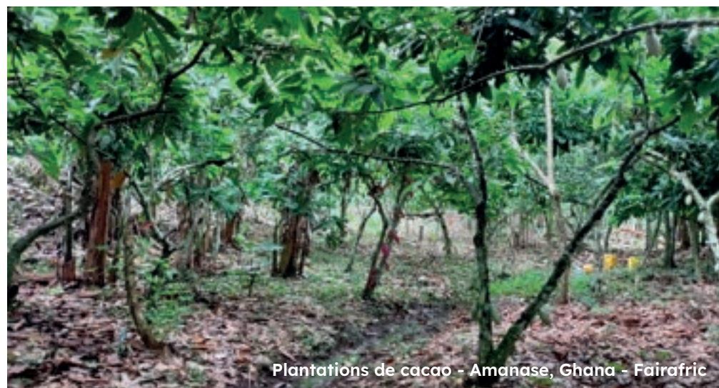
Plantations de cacao - Amanase, Ghana - Fairafric

Ainsi, face à un déficit de l'offre, les prix du cacao n'ont jamais été aussi élevés sur les marchés en bourse (12 000 dollars la tonne en avril 2024 (alors qu'ils oscillaient depuis 7 ans autour de 2 300 dollars la tonne). Ce contexte interroge la durabilité de la filière, et par conséquent l' urgence de la mise en place de nouvelles pratiques de cultures du cacao, plus durables, plus résilientes et plus rémunératrices pour les producteurs et productrices .